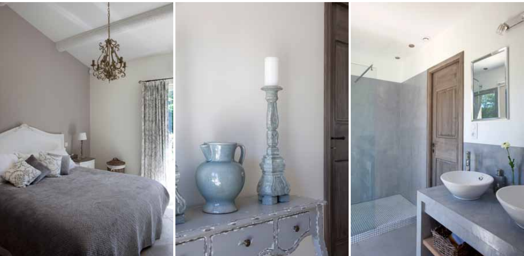
De grijze gordijnen hingen eerst in een andere ruimte, maar hier kwamen ze uiteindelijk beter tot hun recht. De gordijnstof van Chivasso past mooi bij het beddengoed. De kroonluchter is van Pomax, net als de console tegenover het bed en de kaarsenhouders.

Een ander minpunt was dat het gebouw eigenlijk iets te klein was voor wat we zochten." Maar daar vonden ze een oplossing voor. Ze besloten van de bestaande garage een woonruimte te maken. Er kwam een slaap- en badkamer en ook een speelkamer voor de kinderen. Deze extra kamers komen goed van pas. Daarnaast installeerden ze ook een groot overdekt terras, dat eigenlijk nog een extra leefruimte vormt.